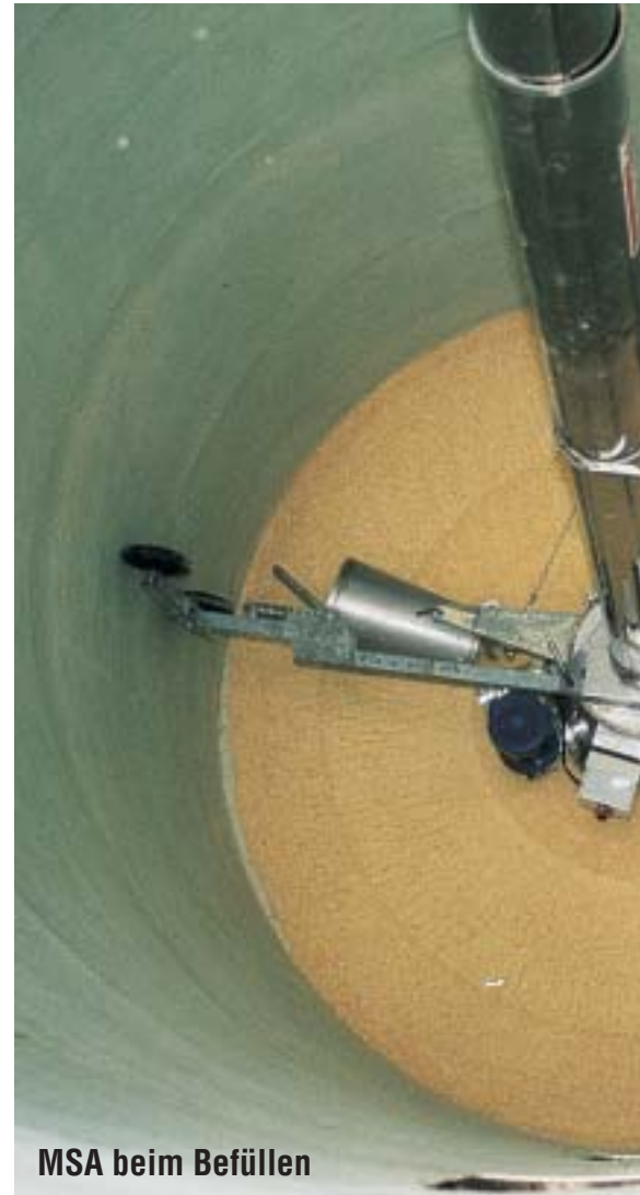
MSA beim Befüllen