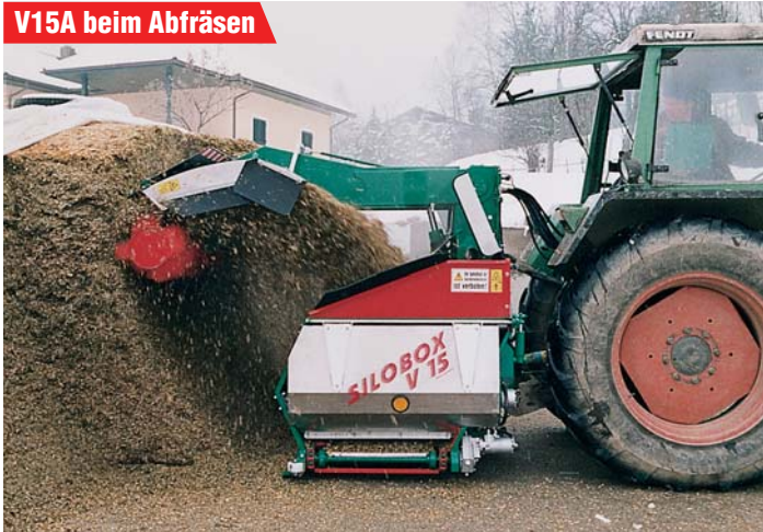
V15A beim Abfräsen