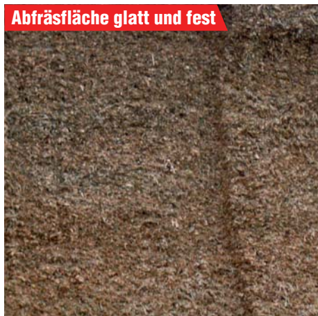
Abfräsfläche glatt und fest