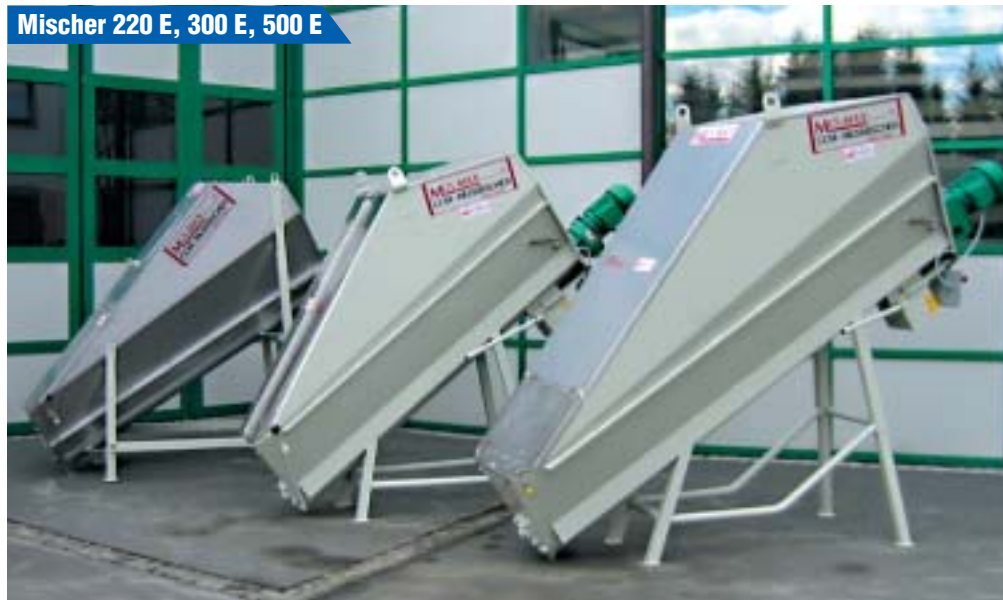
Mischer 220 E, 300 E, 500 E

Alle unsere Geräte und Maschinen werden ständig geprüft und weiterentwickelt. Wir behalten uns etwaige technische Änderungen und Leistungsangaben vor. © 2003 by MUS-MAX/Österreich