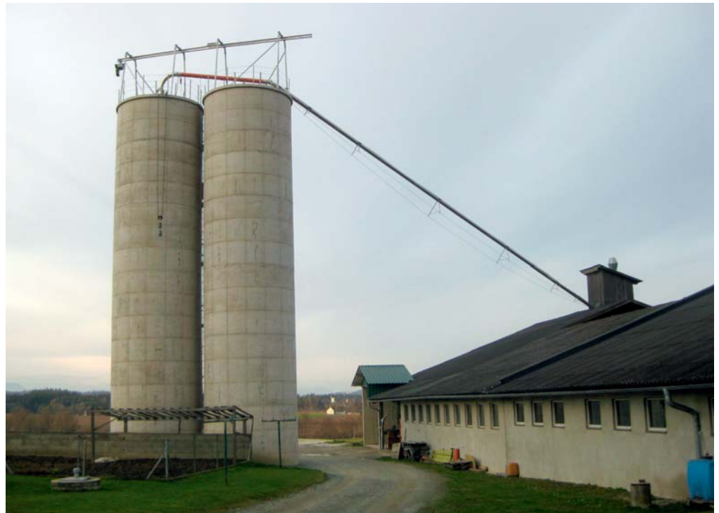
Moderne Silofräsanlage mit Kranbahn, elektrischem Aufzug, Niro-Ablaufleitung und Turbo-Zyklon am Dach des Stalles. (Für Turbo-Zyklon eigener Prospekt vorhanden.)