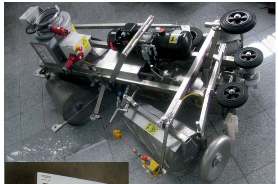
Seilzugschalter für Not-Stop-Einrichtung bei Typ HMSB 350.