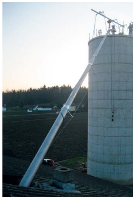
Edelstahl-Ablaufleitungen werden pfeilgerade direkt bei den Kunden geschweißt und montiert. Hier befindet sich das Absauggebläse auf der Silokrone.

Dieses Qualitätsprodukt aus dem Hause MUS-MAX wird überreicht durch: