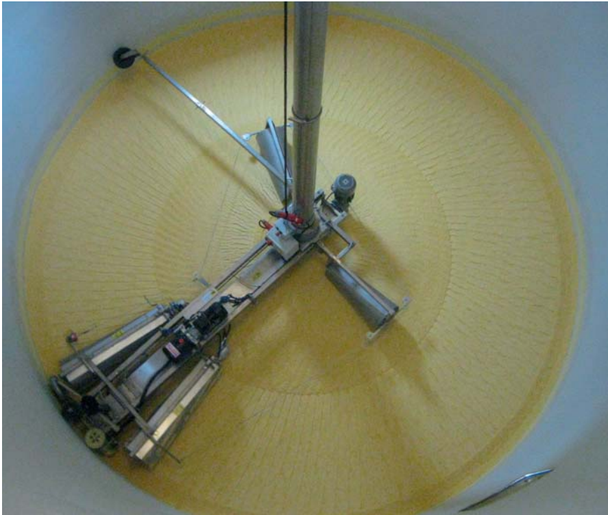
HMSB 500-Fräse (ø 5 m) beim Verteilen und Verdichten von CCM-Maiskornschrötsilage. Das eckige Teleskoprohr (siehe rechts) hält den Schleifring gegen Verdrehung zurück.