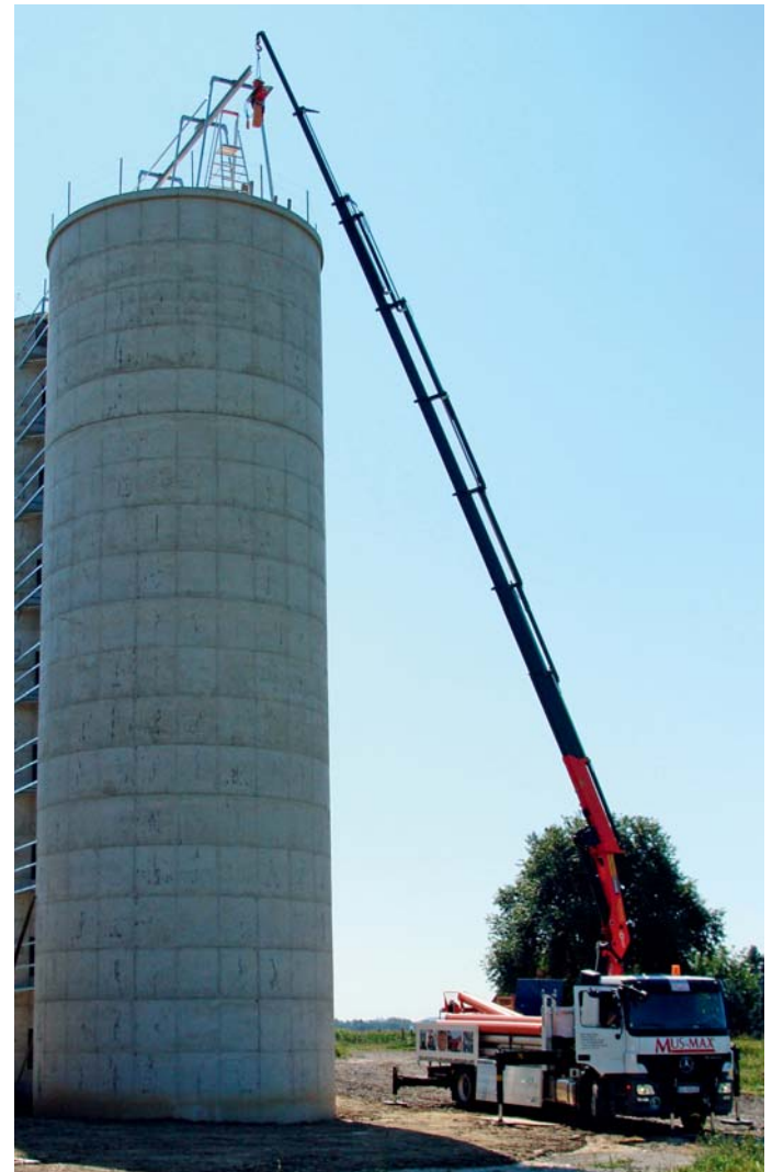
Die Krananlage und die Förderleitungen werden mit dem firmeneigenen Kranwagen montiert.