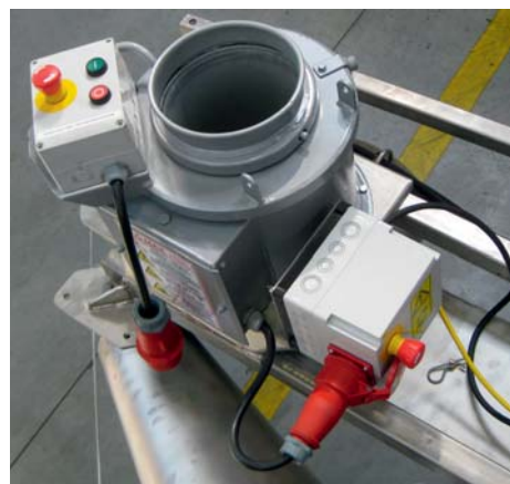
Es befinden sich 2 Steuerkästen an der Fräse mit Bedienknöpfen und Not-Aus-Schalter.

Beim Befüllen von CCM-Silage ändert sich die Drehrichtung sowohl der Walzen als auch der Schnecke. Es muss kein einziger Teil abmontiert werden. Nur umschalten auf Befüllen – fertig!