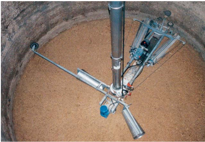
HMSB 600-Fräse im Entnahme-Einsatz bei Maishäckselsilage (Verteilen nicht möglich).