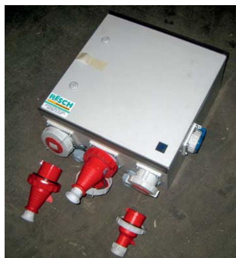
Der Verteilerkasten wird am Silo oben am Geländer fixiert: für Fräse, Licht und elektr. Kettenzug.