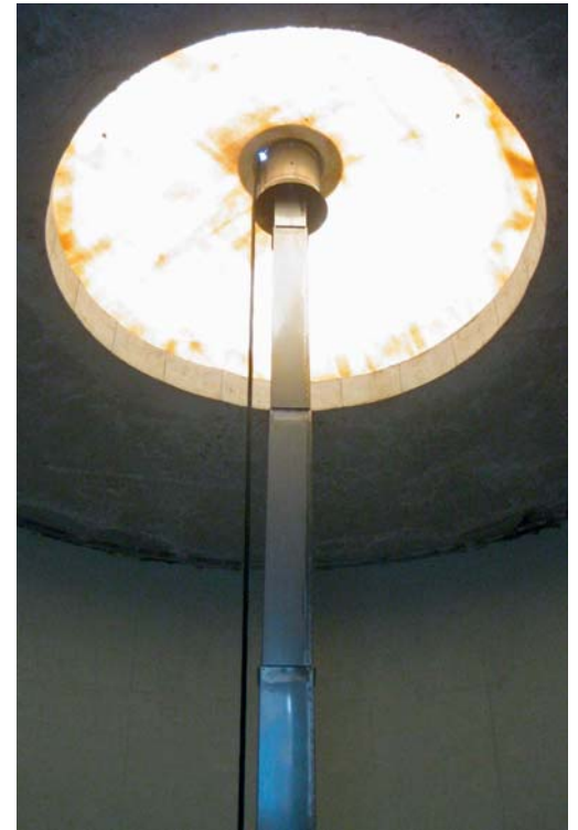
Edelstahl-Teleskop eckig – muss beim Befüllen nicht umgedreht werden.