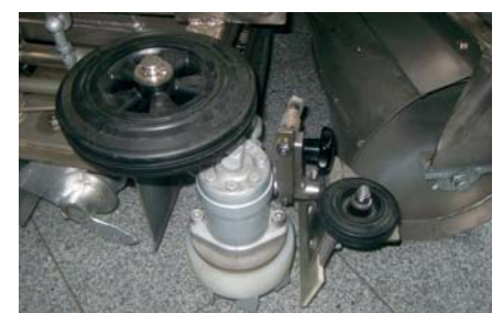
Eisfräser hydraulisch angetrieben.