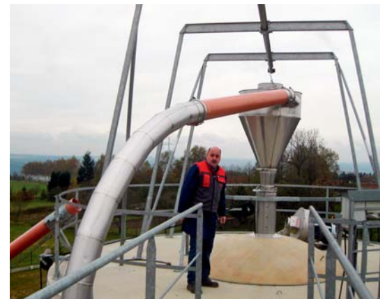
Das Teleskoprohr wird mit Schutzrohr-Überlage und Stützfüßen gehalten. Beim Silieren wird das Gebläse auf der Silodecke abgesetzt und das Zyklon mit der Blasleitung montiert.