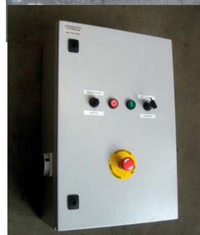
Schaltkasten MB1 für die Futterzentrale.